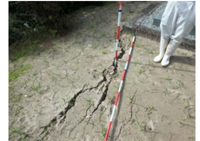
急傾斜地：危険度A判定箇所