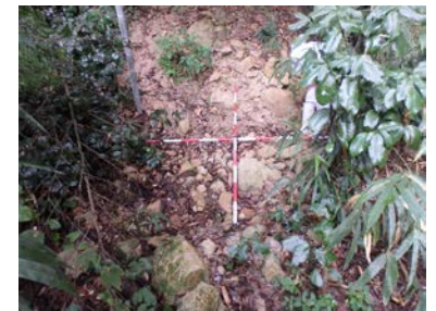
急傾斜地：危険度B判定箇所